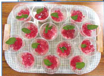
【おやつ】紫陽花のゼリーです。